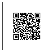
Zažádejte o vytyčení